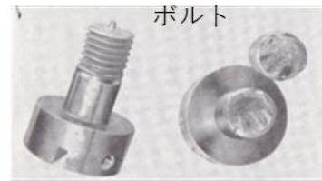
疲労破壊事例写真